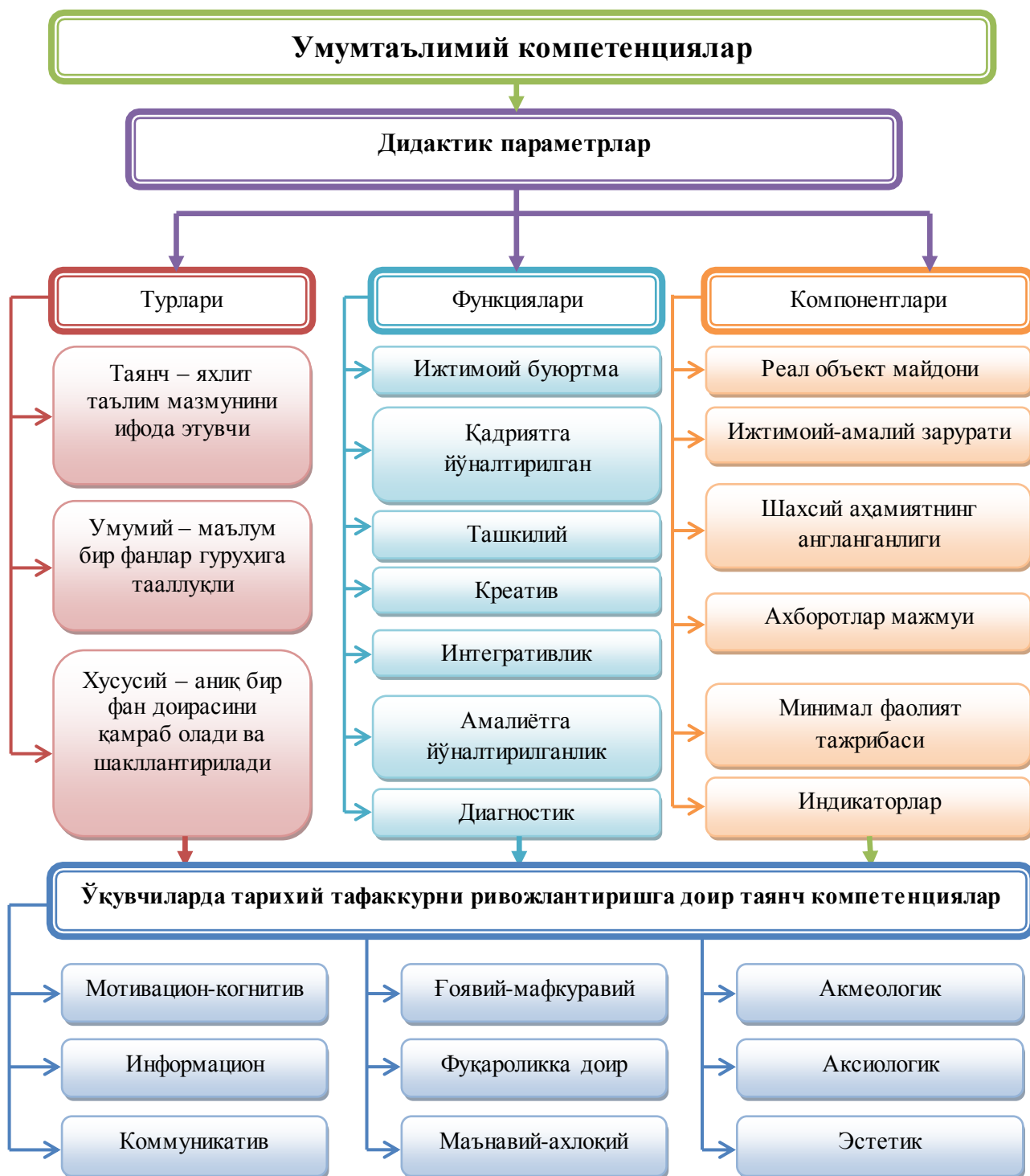
1-расм. Тарихий тафаккурни ривожлантиришнинг умумтаълимий компетенциялари тизими

Тадқиқот жараёнида ўқувчиларда тарихий тафаккурни ривожлантиришга доир таянч, фанлараро, хусусий компетенциялар, уларнинг функциялари ва компонентлари аниқланди ҳамда таълим мазмунини модернизациялаш жараёнида амалиётга татбиқ этилди (1-расм).