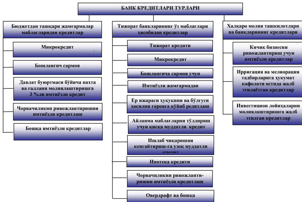
1.1.-расм. Фермер хўжаликларига банк кредити турлари

Дастлаб бу тажриба 4та, кейинчалик 8та вилоятда синаб кўрилган бўлса, 2005 йил хосилидан бошлаб барча вилоятлардаги фермер хўжаликларига пахта ва ғалла етиштириш учун транс маблағи ўрнига имтиёзли кредитлар берилди. Бу фермер хўжаликларини маблағ билан таъминлашнинг бозор тамойилларига мос келадиган усулларга ўтишда муҳим кадам бўлди. Фермер хўжаликларига банк кредити турлари қуйидаги расмдан кўриш мумкин.