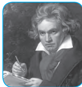
Людвиг ван Бетховен

Ертеде әскерлерді соғыс алдынан нағара, керней-сырнайлар тартып жігерлендірген. Музыканың даусы мен әуені олар жүрегінде Отанға деген махаббатын оятқан.