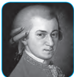
Вольфганг Амадей Моцарт