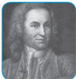
Иоганн Себастьян Бах