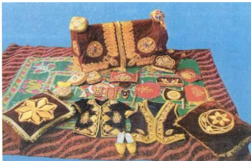
Зардўзлик санъати намуналари