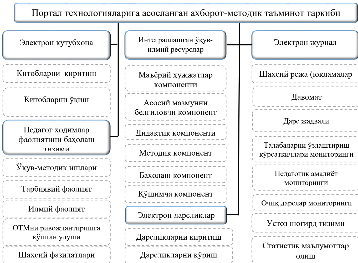
2-расм. Портал технологияларига асосланган ахборот-методик таъминот таркибий тузилмаси

қилиши ва тўғри йўналтириши; компьютернинг ҳисоблаш имкониятларидан фойдаланиш туфайли ўқув вақтини тежаш; ўқув материалларини визуаллаштириш; ўрганилаётган ҳодиса ва жараёнларни моделлаштириш ва имитациялаштириш; ўқувчиларни ўз-ўзларини назорат этишлари; ҳар хил ҳолатларда оптимал қарор қабул қилиш малакасини шакллантириш; фикрлашнинг аниқ бир шакли (кўргазмали-образли, назарий)ни ривожлантириш; ўқиш мотивларини ошириш; билиш фаолияти маданиятини шакллантириш каби имкониятларни яратади.