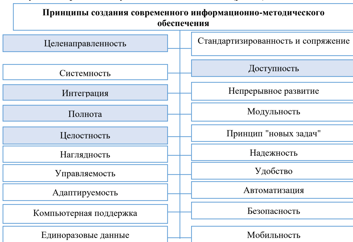
Рис. 1. Принципы создания и развития современного информационно-методического обеспечения на основе порталных технологий

современных информационных технологий, в частности, внедрение информационно-методического обеспечения на основе порталных технологий, а также разработка принципов его создания. В результате проведенных изысканий выявлены четыре существующих концептуальных принципа создания и развития современного информационно-методического обеспечения на основе порталных технологий, а также усовершенствованы существующие принципы путем добавления новых (рис. 1).