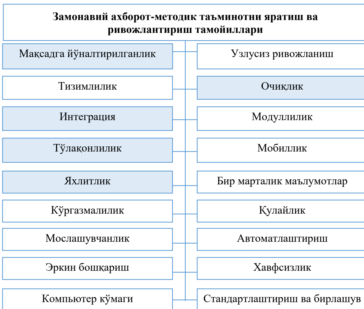
1-расм. Портал технологияларига асосланган замонавий ахборот-методик таъминотни яратиш ва ривожлантириш тамойиллари

Диссертацияни “Таълим жараёнларини ахборот-методик таъминотини амалга оширишнинг портал технологиялари” деб номланган иккинчи бобида замонавий ахборот-методик таъминотни ўзида мужассамлаштирган портал дастурий платформасини педагогик лойиҳалаштириш, портал технологиялари асосида ўқув-илмий ресурсларни тақдим этишнинг шакл ва воситалари ҳамда узлуксиз таълим жараёнларини ягона ахборот-методик таъминотини амалга оширувчи портал таркиби ва мазмуни ёритилди.