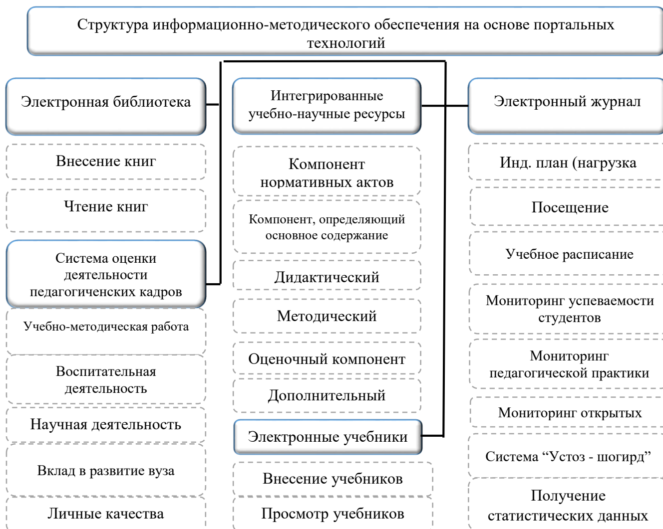
Рис. 2. Организация структура информационно-методического обеспечения на основе порталных технологий

Разработаны структура системы, обеспечивающей интеграцию информационного обеспечения, и содержание учебного материала, ориентированного на наглядное представление разделения учебных элементов учебного материала и его иерархической структуры при создании современного информационно-методического обеспечения (рис. 2), а также освещены этапы проектирования программной платформы (функции руководителя проекта, методиста, дизайнера, программиста, педагога).