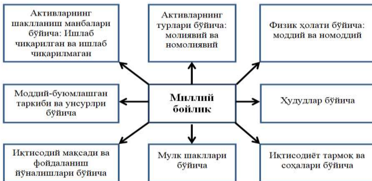
1-расм. Миллий бойлик унсурларининг гуруҳланиши 11

Миллий бойлик категориясини тадқиқ қилишда унинг таркибий қисмларини таснифлаш алоҳида илмий-услубий аҳамиятга эга. Иқтисодчи олимлар миллий бойликнинг таркибий қисмларини гуруҳлаш ва таснифлашда қуйидаги белгиларга эътибор қаратиш лозимлигини таъкидлайди (1-расм).