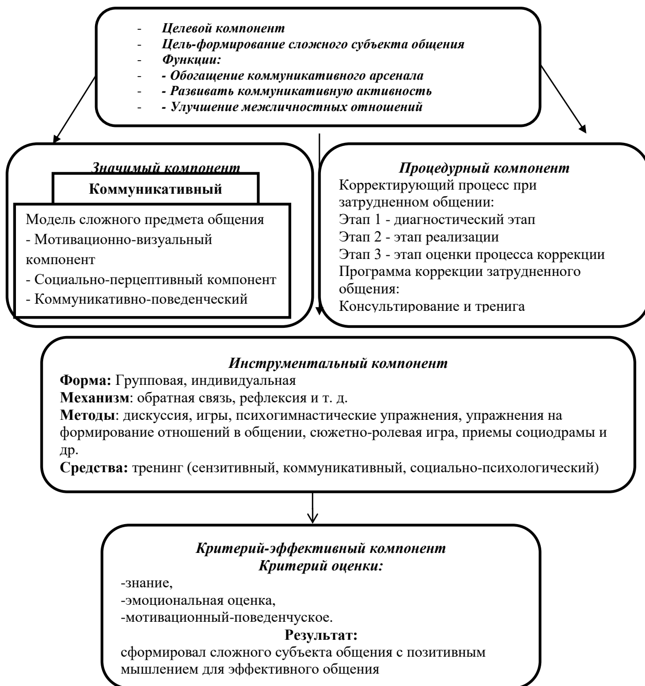
Рисунок 1. Коррекционная модель коммуникативных трудностей в подростковом возрасте

По результатам методики в контрольной группе по экспрессивной речи первоначально был определен показатель M1=10,7 , а затем M2=10,6 , тогда как в экспериментальной группе перед тренировочным занятием отмечался показатель M1=9,4 , а после тренировки-показатель M1=11,8 . Эти результаты указывают на то, что взгляды испытуемых в экспериментальной группе на выразительную речь в некоторой степени изменились.