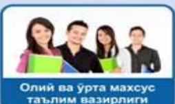
Олий ва ўрта махсус таълим вазирлиги