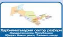
Ҳарбий-маъмурий сектор раҳбари (Дармавоқифотин Республикаси Жумҳурияти Республика раҳбари, Соҳиботин кенгаши ва кўмакчилар қўмитаси)