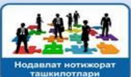
Нодавлат нотижорат ташкилотлари