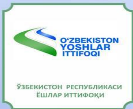
ЎЗБЕКИСТОН RESPUBLIKASI ЁШЛАР ИТТИФОҚИ