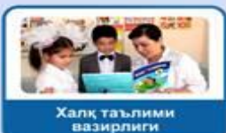
Халқ таълими вазирлиги