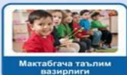
Мақтабгача таълим вазирлиги