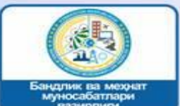
Бандлик ва меҳнат муносабатлари вазирлиги