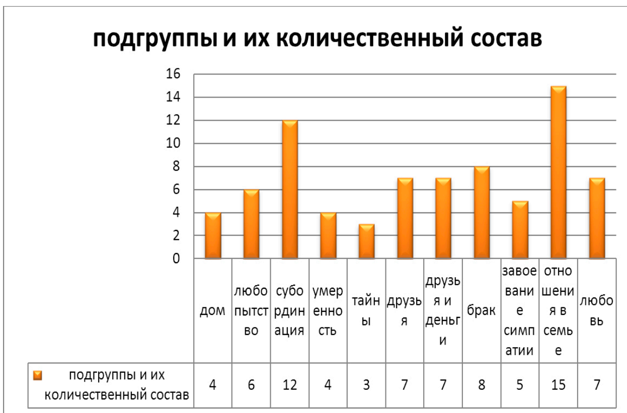
Рисунок 2. Разделение английских ФЕ на подгруппы и их количественный состав.