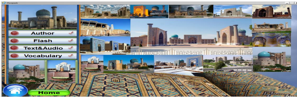
2-расм. Асосий ойна

Enter тугмаси орқали кейинги ойнага ўтилади. Дастурни ишлатиш учун тугмаларни танлаш талаб қилинади. Дастур интерфейсининг асосий кўриниши ҳосил бўлади: