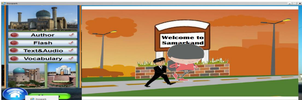
3-расм. Flash Тугмани танлаш орқали ишланмани кўриниши ёритилади.

Enter тугмаси орқали кейинги ойнага ўтилади. Дастурни ишлатиш учун тугмаларни танлаш талаб қилинади. Дастур интерфейсининг асосий кўриниши ҳосил бўлади: