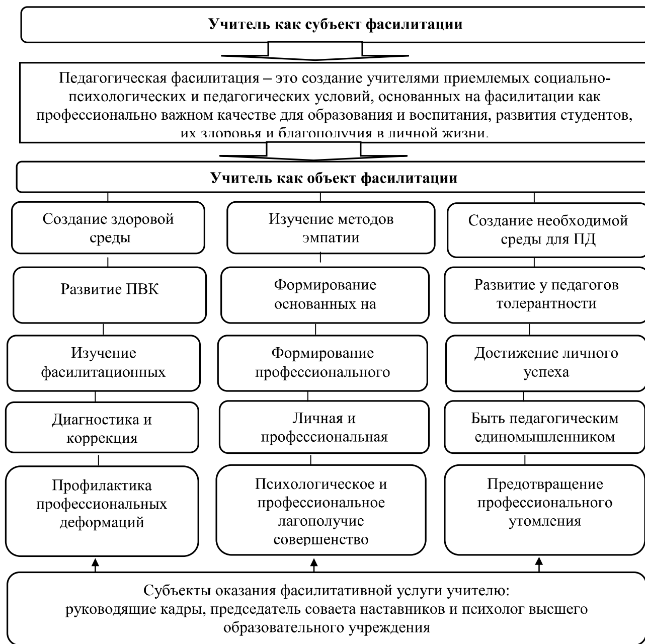
Рис. 1. Учитель как объект педагогической фасилитации

Чтобы сформироваться как успешный педагогический фасилитатор, самому учителю необходимо оказать фасилитаторскую услугу. В этом случае педагог выступает как объект фасилитации. По отношению к учителю в качестве субъекта деятельности выступают руководящие кадры и психологи высшего образовательного учреждения (рис. 1).