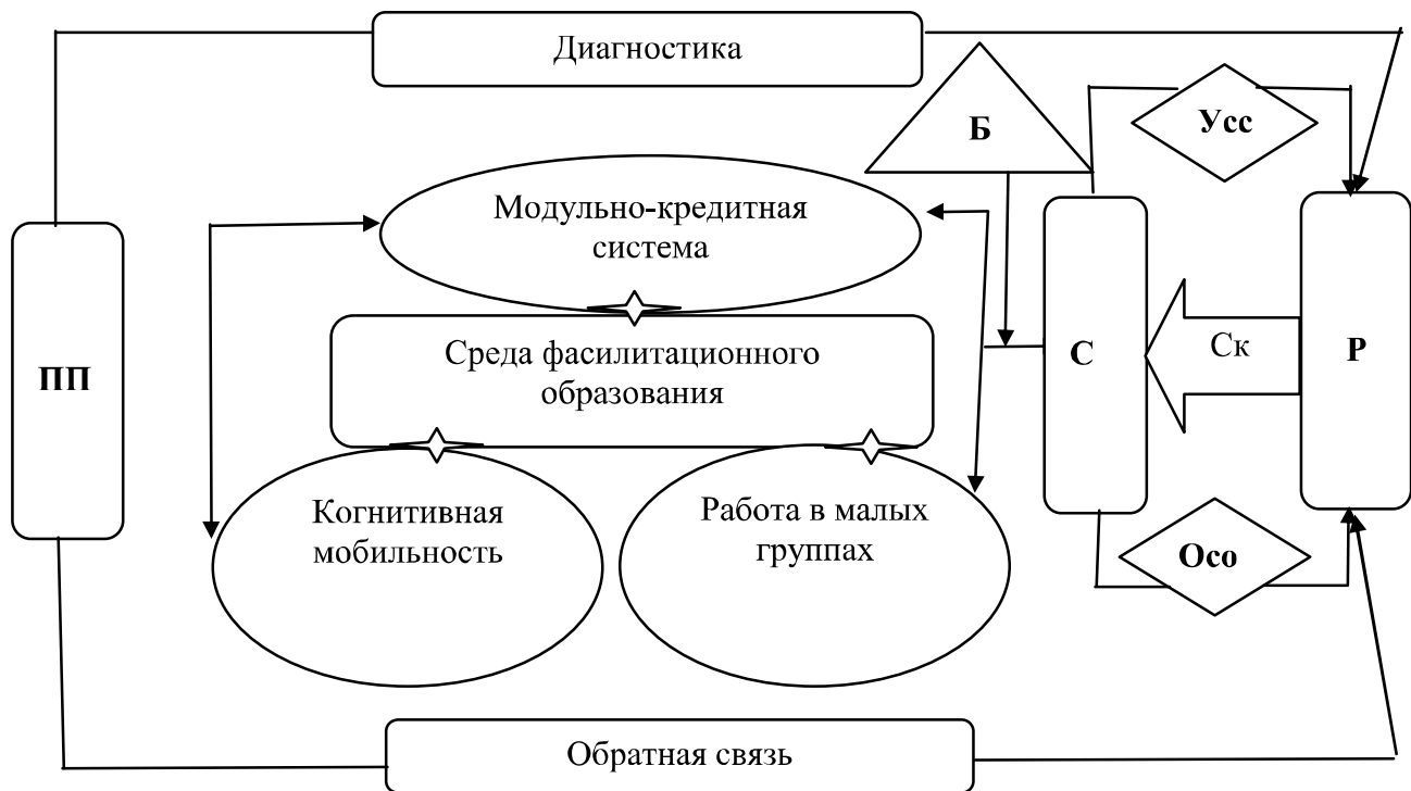
Рис. 2. Модель организации самостоятельных работ студентов посредством педагогической фасилитации: ПП – профессор-преподаватель; С – студент; Р – результат; Б – барьеры; Усс – уровень самостоятельности студентов; Ск – самоконтроль; Осо – организация самостоятельного образования

С учетом данного аспекта в рамках исследования разработана технология организации самостоятельных работ студентов на основе педагогической фасилитации, направленная на поощрение деятельности студентов по работе в сотрудничестве (рис. 2). В качестве основы предлагаемой модели определена среда фасилитационного образования.