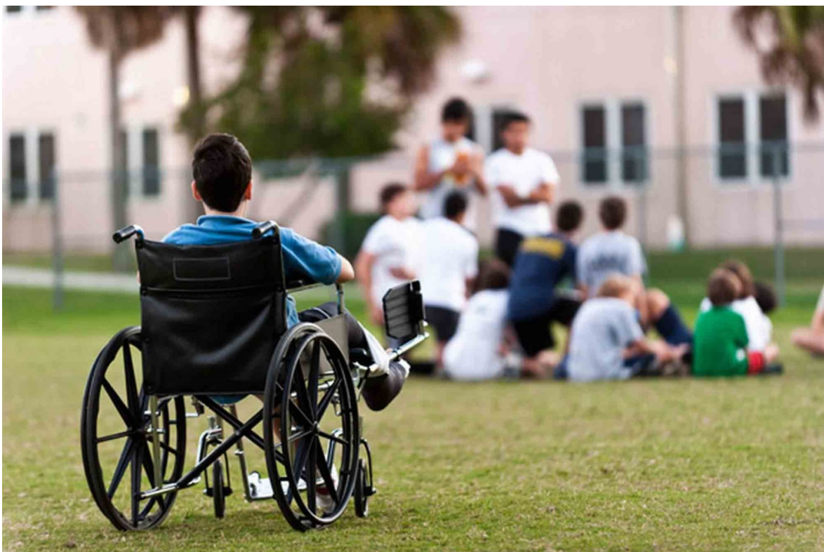
Ногирон болаларнинг жамиятга интеграциялашуви 116

Интервью борасида келишар экансиз, болага бажара олишингизга кўзингиз етмайдиган ваъдалар берманг (масалан, мақола эълон қилинганидан кейин албатта уни онаси келиб олиб кетишини, ёки уни кимдир фарзандликка олишини ёхуд уни даволаш учун зарур пулни берадиган ҳомийлар топилишини айтманг). Ширинликлар, машҳур бўлиб кетиши ҳақидаги ваъдалар, уни уйингизга меҳмонга олиб кетишингиз ёки кинога олиб тушишингиз ҳақидаги бажаришингиз гумон бўлган ваъдалар билан уни «сотиб олишга» уринманг. Бу кўпроқ Меҳрибонлик уйлари ва интернатларда тарбияланаётган болаларга тааллуқли бўлиб, нафақат журналист, балки ҳар қандай инсон кўнглидан уларга нисбатан ачиниш ва ҳамдардлик ҳисларини ўтказиши иабий. Мабодо бирор бир ваъда бериб қўйган бўлсангиз уни албатта бажаринг. Йўқса, болада катталарга ва уларнинг ваъдаларига ишонч йўқолиши мумкин. Қолаверса, бир нарса доим ёдингизда бўлсин: сиз ушбу боланинг ҳаёти учун масъулиятни бўйнингизга ола олмайсиз, ҳеч ким сизни у билан дўстлашишга ва мулоқотда бўлиб туришга мажбур қилолмайди (лекин ҳаётда ана шундай дўстлашув ҳолатлари ҳам учраб туради). Сизнинг асосий вазифангиз – мана шу болага ва шунга ўхшаш вазиятга тушиб қолган бошқа болаларга ёрдами тегиши мумкин бўлган сифатли материал тайёрлаш.