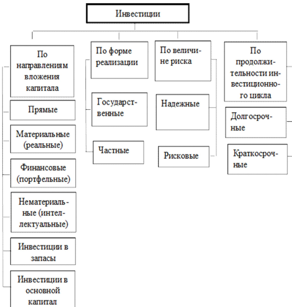
Рисунок 1. Классификация видов инвестиций

Приведенная выше классификация видов инвестиций не исчерпывающая. На рис. 1. приведена классификация видов инвестиций по критериям: направления вложения капитала, форме реализации, величине риска и продолжительности инвестиционного цикла. Такая классификация дает возможность не только увидеть различие видов инвестиций, что очень важно, но и позволяет, в определенной мере, установить взаимосвязь между ними, определить технологическую и социально-экономическую структуру инвестиций.