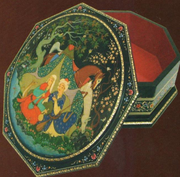
Шорасул Шаахмедов. Кутича. «Севишганлар боғда». Тошқоғоз, пигмент, юпка зарварақ, лак. 2002.