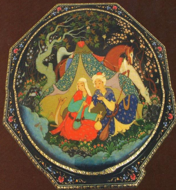
Sharasul Shaakhmedov. Box. «Lovers in the garden». Papier-mache, pigment, gold leaf, lacquer. 2002.