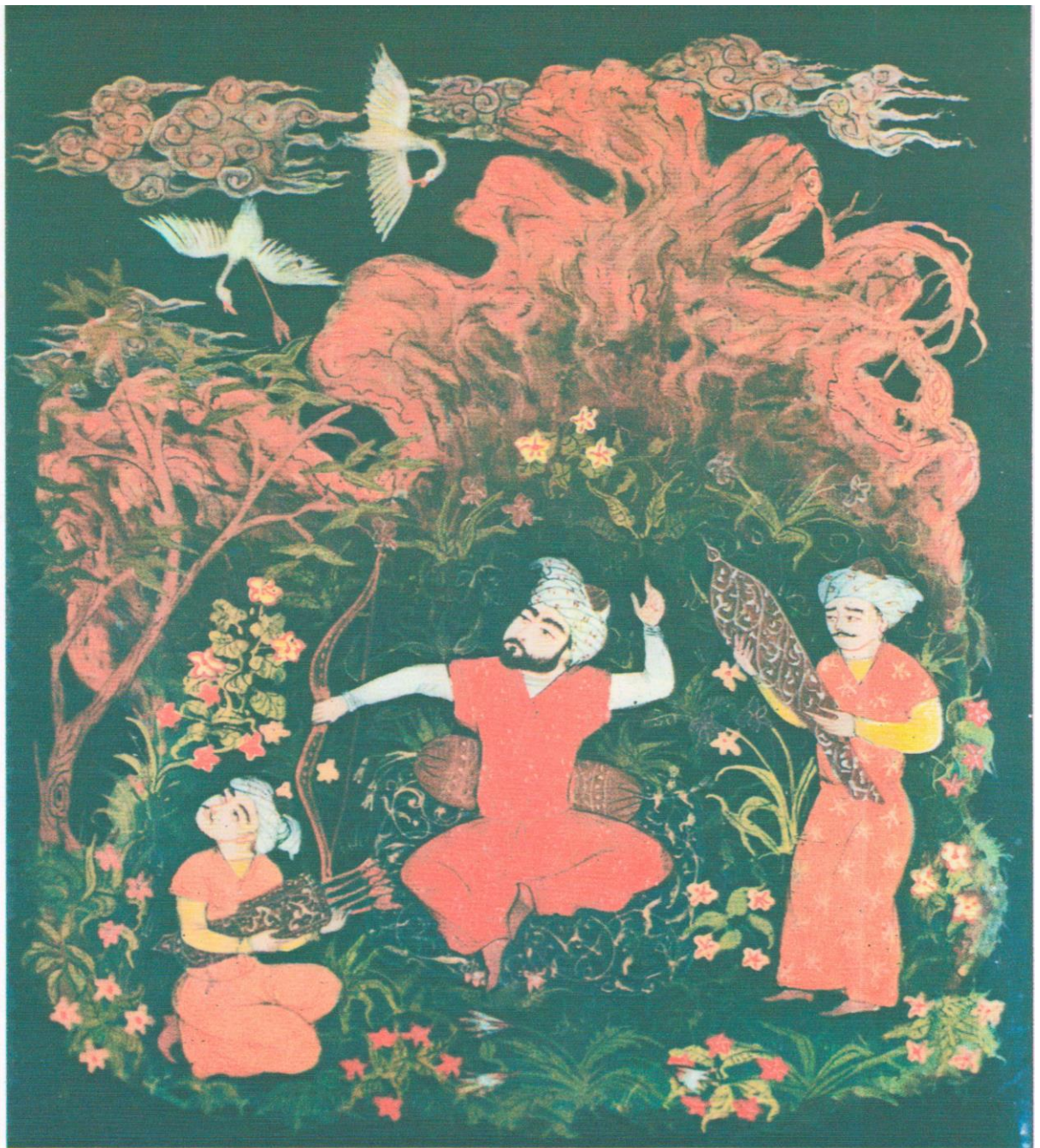
Ғани Алдашев. Ов манзараси. 1985 й. 12-1092