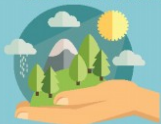
ЭКОТИЗИМЛАРНИ МУҲОФАЗА ҚИЛИШ