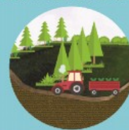
БУЗИЛГАН ЭКОТИЗИМЛАРНИ ҚАЙТА ТИКЛАШ