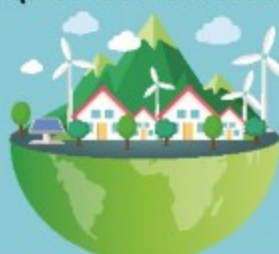
ТАБИАТ КОМПОНЕНТЛАРИДАН ОҚИЛОНА ФОЙДАЛАНИШ