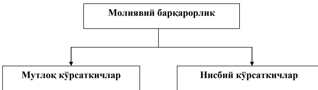
Чизма. 2. Молиявий барқарорликни ифодаловчи кўрсаткичлар

2. Молиявий барқарорлик мутлоқ кўрсаткичлар орқали таҳлил этинг. Таҳлил натижаларини 10-жадвалга жойлаштиринг.