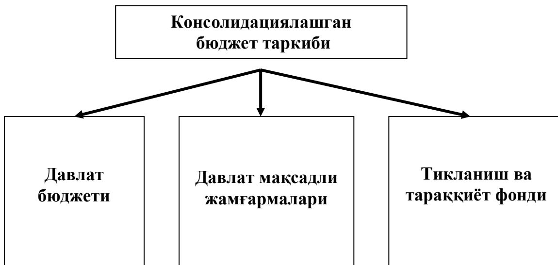
3-расм. Консолидациялашган бюджети таркиби (ихчамлашган) 10

Юқоридаги расмда Ўзбекистон Республикасининг консолидациялашган бюджети таркиби берилган. Бюджет Кодексига мувофиқ, Ўзбекистон Республикасининг консолидациялашган бюджети таркибига қуйидагилар киради: Давлат бюджети; давлат мақсадли жамғармаларининг бюджетлари; Ўзбекистон Республикаси Тикланиш ва тараққиёт жамғармаси маблағлари.