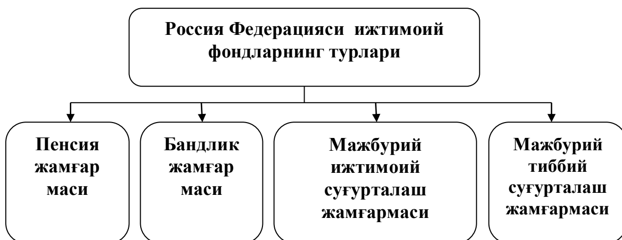
8-расм. Россия Федерацияси ижтимоий фондларнинг турлари 1

Россия Федерациясида соғлиқни сақлаш тизимини молиялаштиришнинг учта механизми мавжуд: Федерал ва минтақавий мажбурий тиббий суғурта; ихтиёрий суғурта; пуллик тиббий хизматдан фойдаланиш.