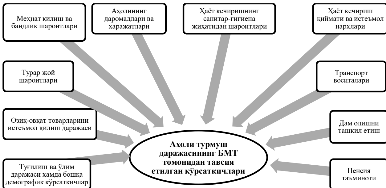
1-расм. Бирлашган Миллатлар Ташкилоти томонидан тавсия этилган аҳоли турмуш даражасини ифодалайдиган кўрсаткичлар тизими 5

мамлакатдаги ижтимоий инфратузилманинг ривожланганлиги, давлат томонидан кўрсатиладиган хизматларнинг миқдори ва сифати, умуман айтганда, ижтимоий соҳа ва аҳолини ижтимоий ҳимоялаш тизимининг ривожланганлик даражаси асосий омиллар бўлиб хизмат қилади.