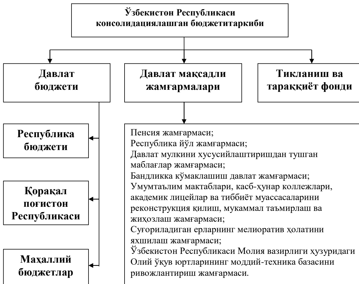
5-расм. Ўзбекистон Республикаси консолидациялашган бюджети таркиби 13

Давлат маблағларнинг мақсадли йўналтирилишига кўра давлат мақсадли жамғармалари ижтимоий ва иқтисодий жамғармаларга ажратилади. Ижтимоий аҳамиятдаги жамғармалар ҳукуматга фаол ижтимоий сиёсатни амалга оширишга имкон беради. Иқтисодий жамғармалар жамиятда хўжалик ва ижтимоий ҳаётининг ривожланишига давлат томонидан таъсир кўрсатиш имкониятларини кенгайтиради.