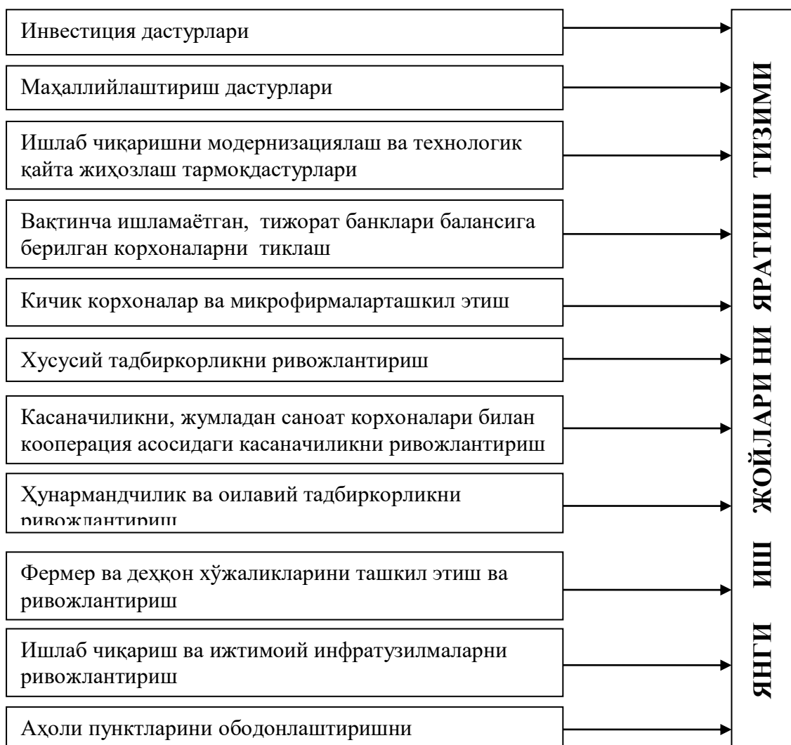
7-расм. Ўзбекистонда янги иш жойларини яратиш тизими 24

Мамлакатимиз иқтисодиётини ислоҳ қилиш ва диверсификациялаш, фаол инвестиция сиёсати юритиш ҳисобига иқтисодиётнинг етакчи тармоқларини модернизациялаш ва технологик жиҳатдан қайта жиҳозлаш, кичик бизнес ва хусусий тадбиркорликни жадал ривожлантиришни рағбатлантириш асосида ҳар йили минглаб янги иш ўринлари яратилмоқда.