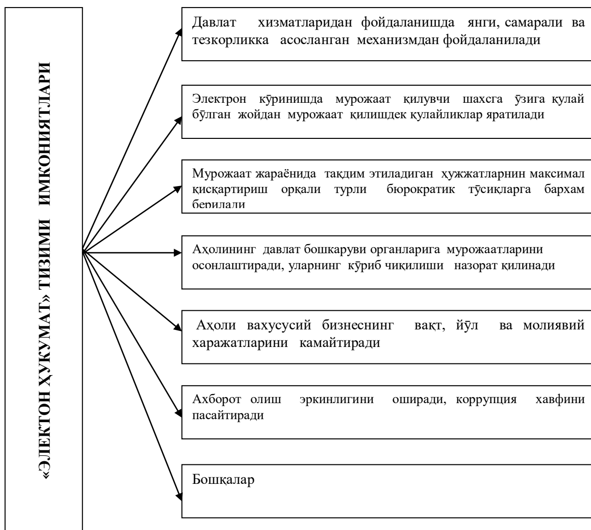
9-расм. “Электрон ҳукумат” тизими имкониятлари 2

Ўзбекистон Республикаси Президенти Ш.М.Мирзиёев таъкидлаган-ларидек, “..Халқ давлат идораларига эмас, давлат идоралари халқимизга хизмат қилиши керак ва бу ҳақиқатни, аввало, барча бўғиндаги раҳбарлар яхши тушуниб олиши зарур” 1 .