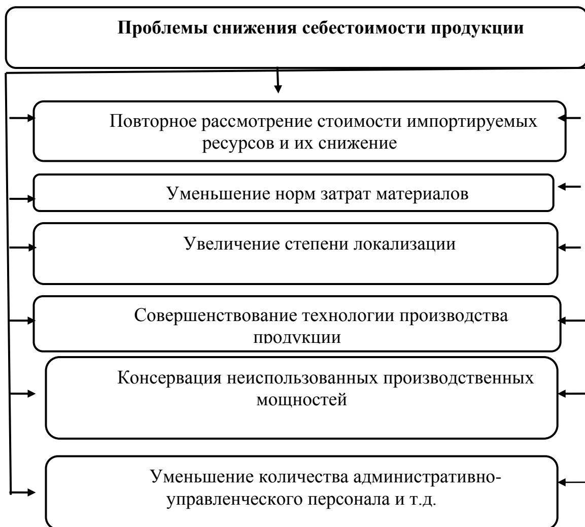
Рис. 2. Основные направления снижения себестоимости продукции 14

Снижение себестоимости и увеличение рентабельности является очень сложной задачей в рамках строгого соблюдения режима экономии трудовых и материальных средств.