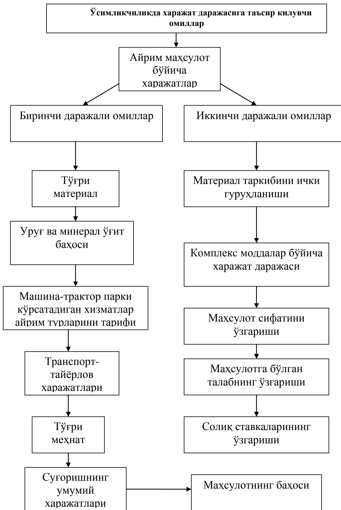
1-расм.Харажатлар даражасига таъсир қилувчи факторлар тизими. 13