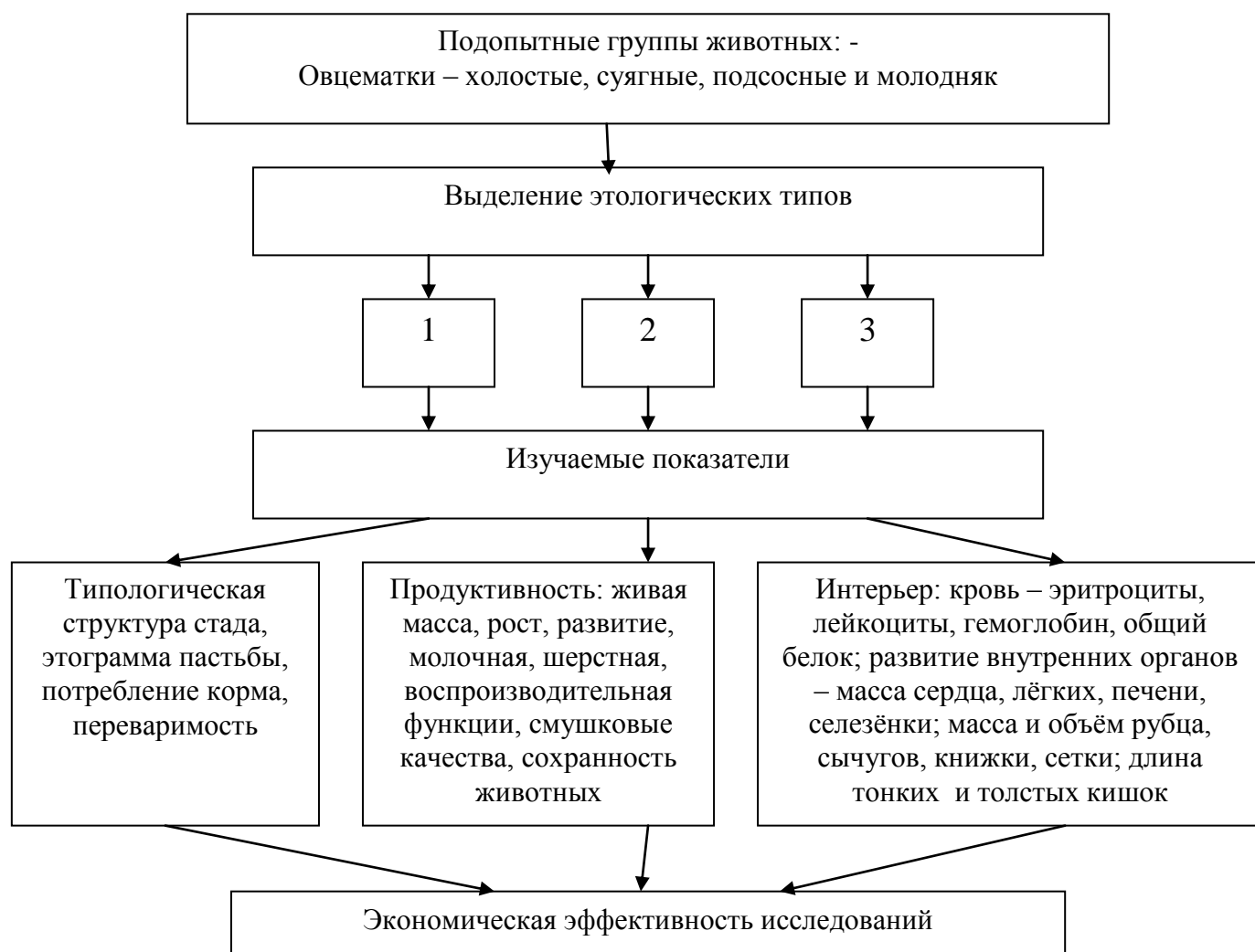
Схема экспериментальных исследований

Оценка того или иного образца поведения животных производилась на основе индекса функциональной активности, который вычислялся по формуле T = t_1 / t_2 ; где t_1 – время функциональной активности, t_2 – общее время наблюдений.